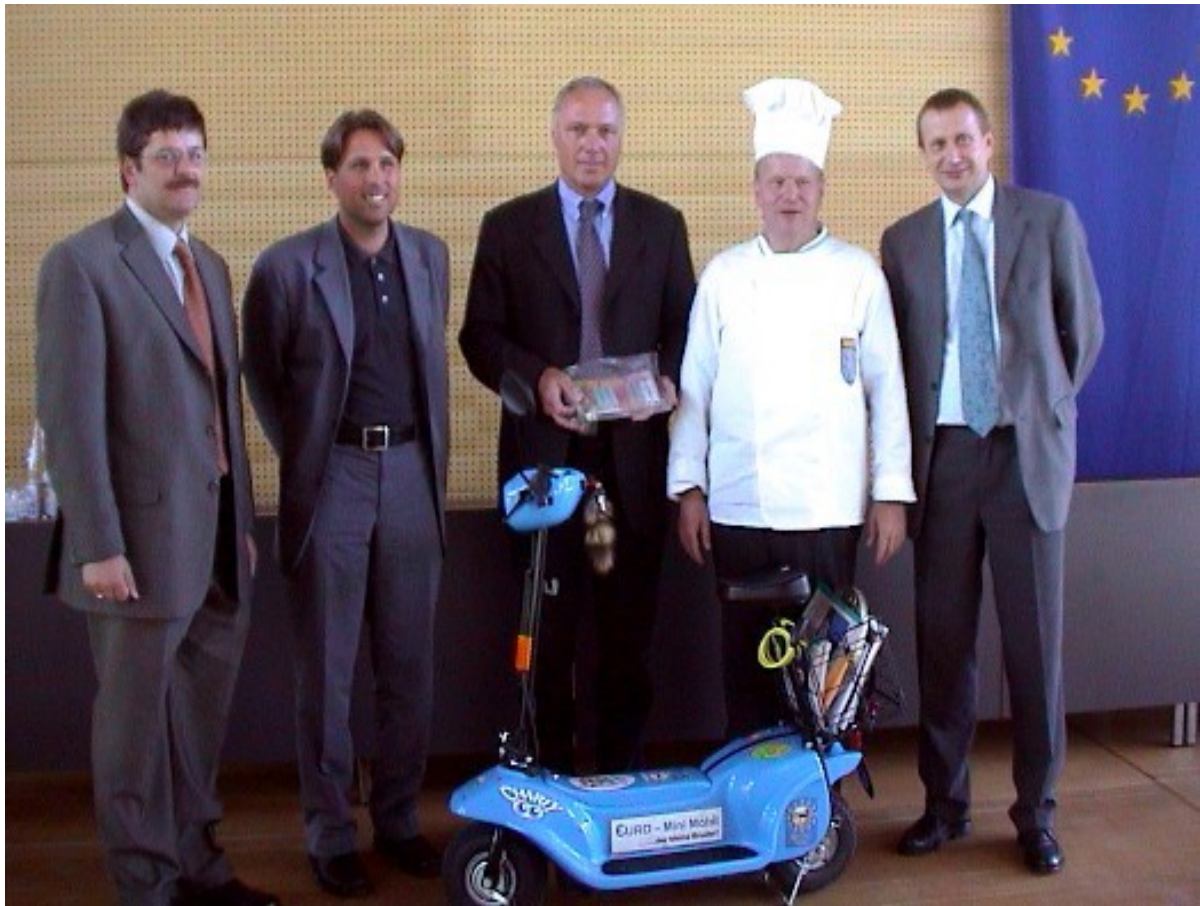
Oben: Europatag 2001 Lienz Osttirol * Unten: Hochzeit ORF Kahlenberg Wien